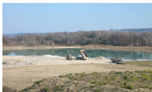
Invaso in c.a. Montecalvo Irpino