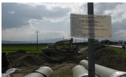
Impianto Irriguo Val di Sangro (CH)