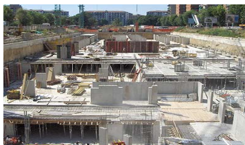
Avellino Cittadella Ospedaliera