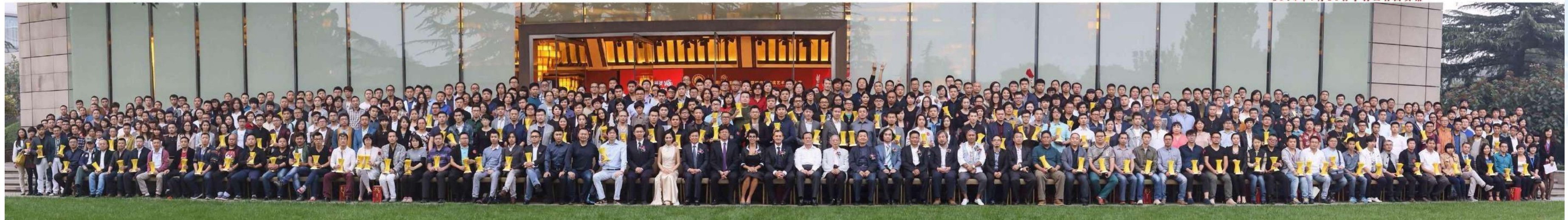
Cerimonia di premiazione presso la Grande Sala del Popolo